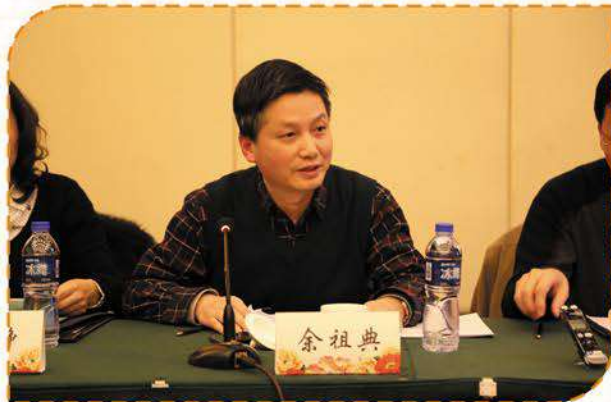
江西保监局副局长余祖典讲话

元月20日，江西省保险行业协会组织召开法律专业委员会成立暨打击保险诈骗推进会，正式揭牌成立了江西保险业反保险欺诈中心，标志着江西省打击保险诈骗工作自此进入制度化、专业化、常态化的合作轨迹。