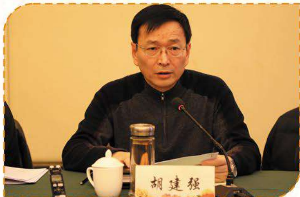
省公安厅经侦总队总队长胡建强讲话